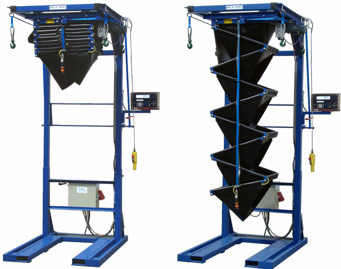
BBF 20 - MONO mit Wiegeeinheit und festen Staplertaschen