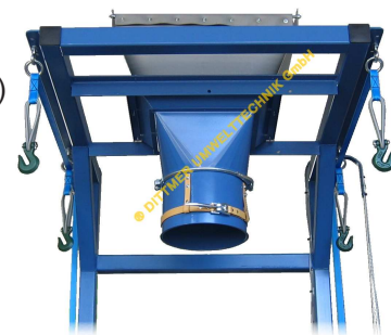
Einlaufstutzen oVC-Ausführung für Schüttgut