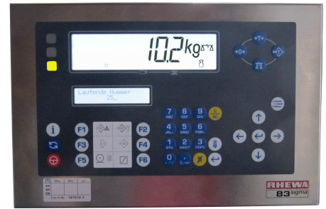
Gewichtsanzeige mit Abschaltung und Signal-LEDs : GELB = Wiegung läuft GRÜN = Wiegung fertig