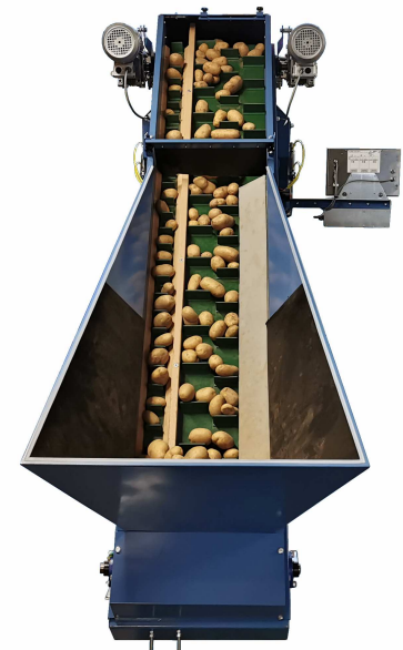
Einlauftrichter mit Gurtabdeckung zur Förderstrombegrenzung bei Kleinpackungen bis 5 kg.