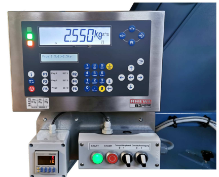
Gewichtsanzeige mit Bedienpult und Vorwahlzählwerk mit Stopp-Funktion. Es werden nur fertig gewogene und abgeworfene Portionen gezählt.