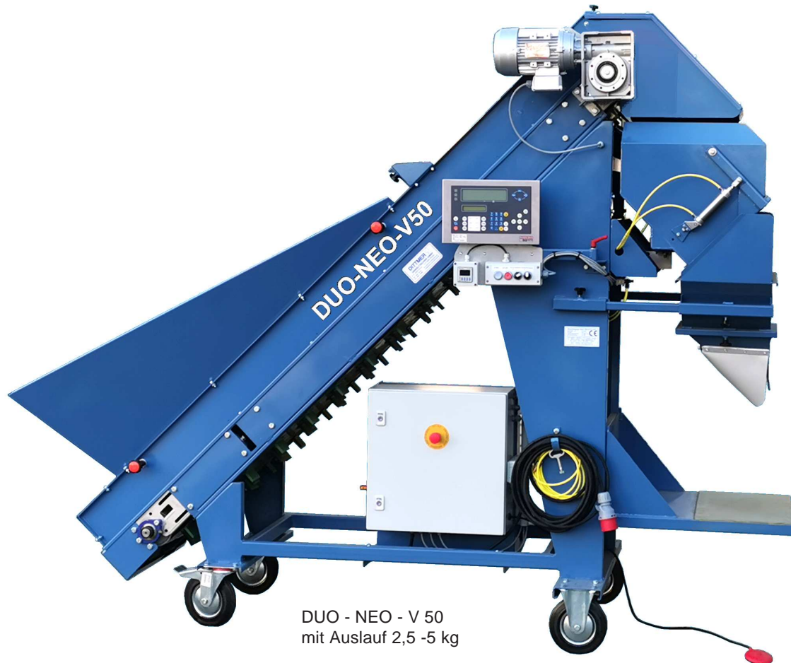
DUO - NEO - V 50 mit Auslauf 2,5 -5 kg