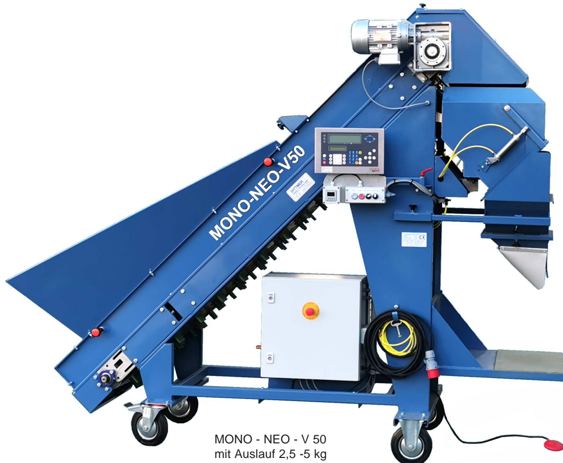
MONO - NEO - V 50 mit Auslauf 2,5 -5 kg