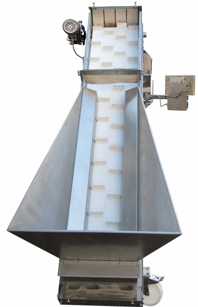
Einlauftrichter mit Gurtabdeckung zur Förderstrombegrenzung bei Kleinpackungen bis 5 kg. Foto: Ausführung Edelstahl